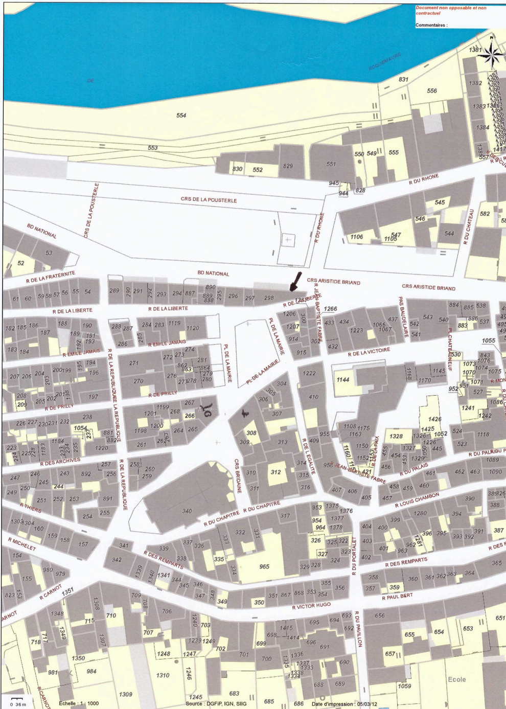
Plan de situation générale